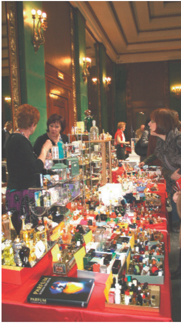
Hier können Sammlerherzen schwelgen. Ein Eindruck von der Parfümflakon-Börse in Baden-Baden (Frühjahr 2009).

vielseitigen Angebotes der Aussteller hat man über die Börsen große Chancen seinen Flakon zu finden.